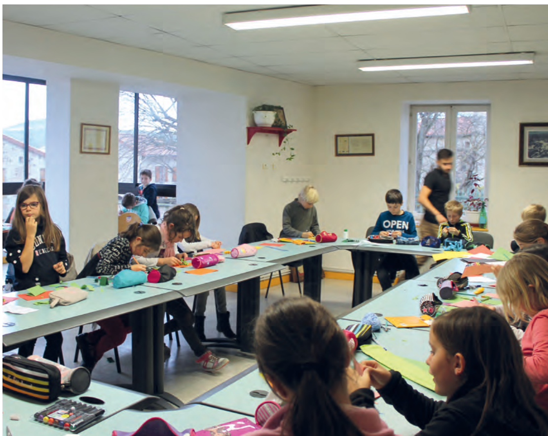
Des enfants heureux de participer aux animations proposées par la Mairie.

L'actualité des écoles est marquée, cette année, par le changement d'organisation de la semaine pour les écoles publiques de la commune, passant de 4 jours à 4 jours et demi avec de nouveaux horaires scolaires.