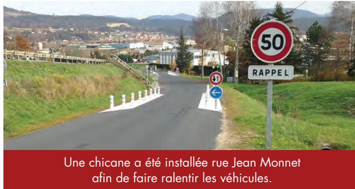
Une chicane a été installée rue Jean Monnet afin de faire ralentir les véhicules.

contrôler la vitesse. Pour votre sécurité et celle des autres, respectez ces limitations.