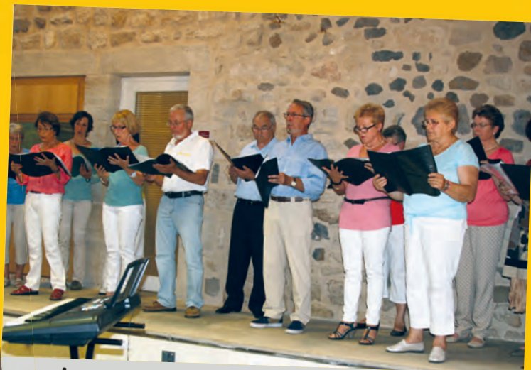
La chorale « La Voix des prés » a chanté pour la Fête de la musique.