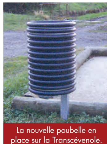
La nouvelle poubelle en place sur la Transcévenole.

✓ Achat d'un tracteur 54 537 € et d'une saleuse autoportée 10 920 €.