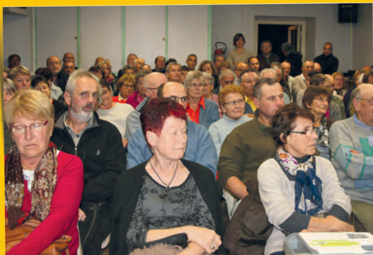
Une bonne participation des citoyens lors des rencontres avec les élus, à Fay, au Villard et au bourg.