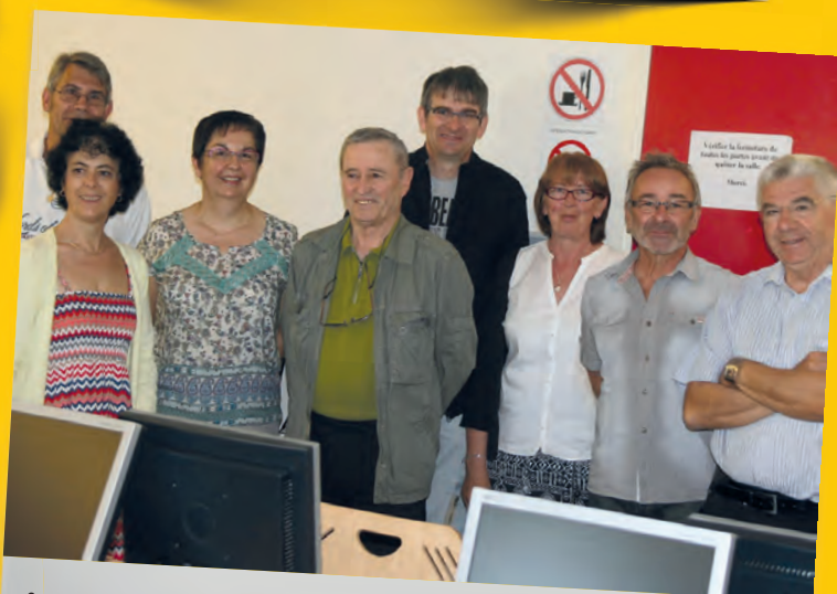
Portes ouvertes du club informatique.