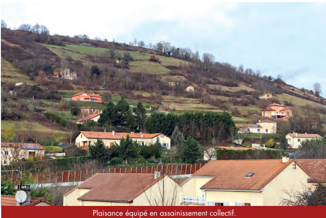
Plaisance équipé en assainissement collectif.

Le secteur, comptant 42 foyers, va être équipé d'un réseau de collecte des eaux usées. En coordination vont être menés les travaux d'éclairage public et de restructuration/dissimulation du réseau électrique.