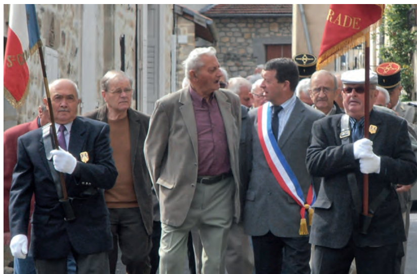
La commémoration du 8 Mai a été la première sortie officielle du nouveau maire.

Ce produit est issu de forêts gérées durablement et de sources contrôlées. / pefc-france.org