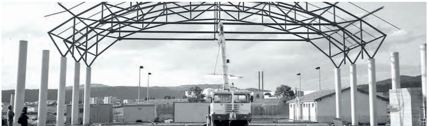
Situé au lieu dit « La Plaine », le gymnase et la salle polyvalente sont inaugurés en juin 1994.