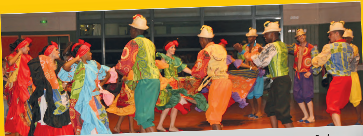
Une première participation d'Interfolk à Saint-Germain avec Cuba.