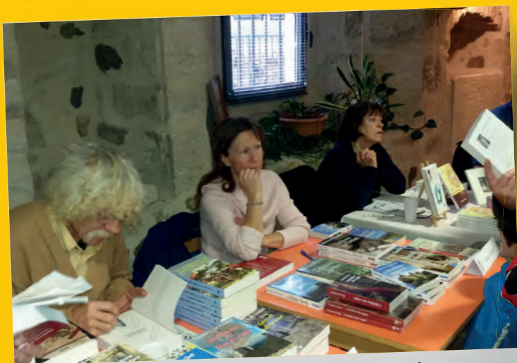
Auteurs en scène : un succès grandissant pour cette 3 e édition.