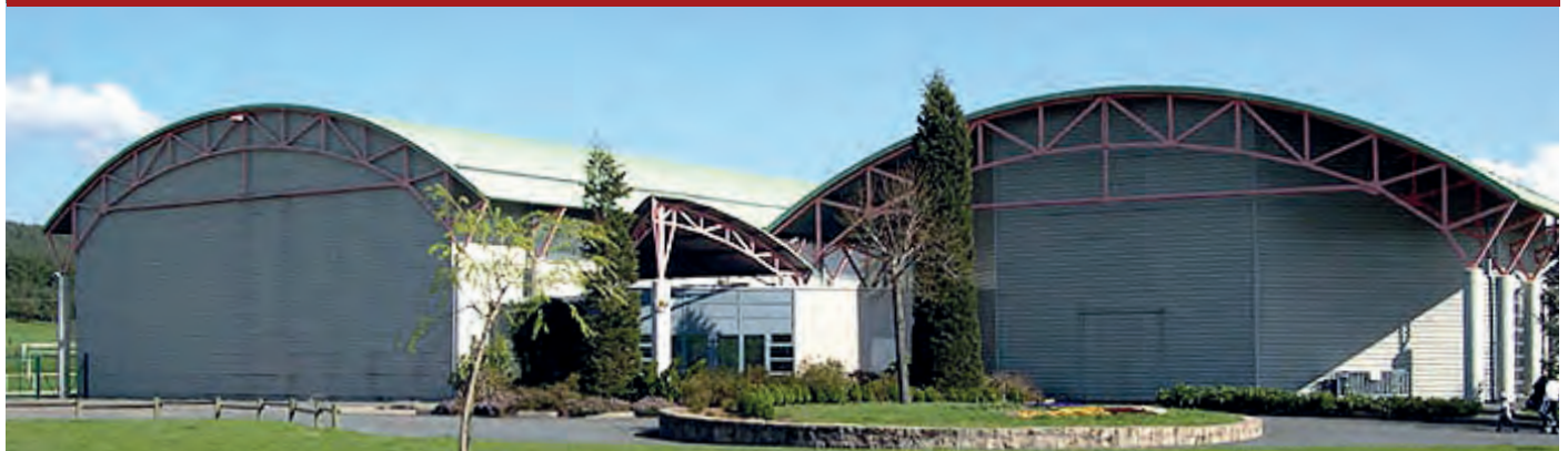
Le complexe sportif offre à tous la possibilité d'exercer de nombreuses activités, qu'elles soient sportives ou ludiques.