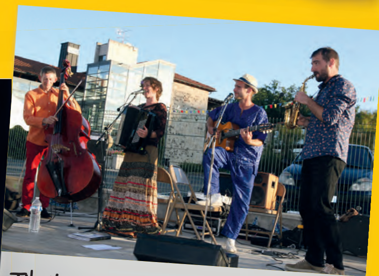
Tikvitsa a séduit le public de la vogue.