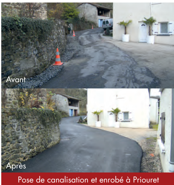
Pose de canalisation et enrobé à Priouret