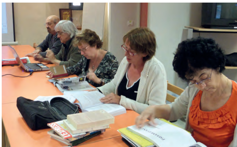
Quelques membres de l'association SLT à l'ouvrage.