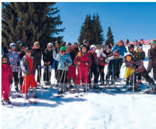
Camp ski du centre de loisirs.

L'activité périscolaire que l'État a octroyée aux communes sans trop de moyens, n'est pas si simple à mettre en œuvre. C'est parfois complexe et alambiqué pour essayer de trouver un fonctionnement dans l'intérêt des enfants. Aussi, je tiens à remercier les élus, le personnel et les bénévoles pour toute l'énergie consacrée à la réussite de cette nouvelle activité.