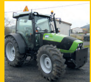
Le nouveau tracteur quatre roues motrices.

✓ Achat d'un tracteur 54 537 € et d'une saleuse autoportée 10 920 €.