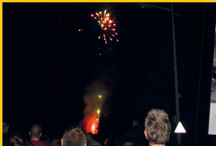
Un très beau feu d'artifice pour clôturer la vogue.