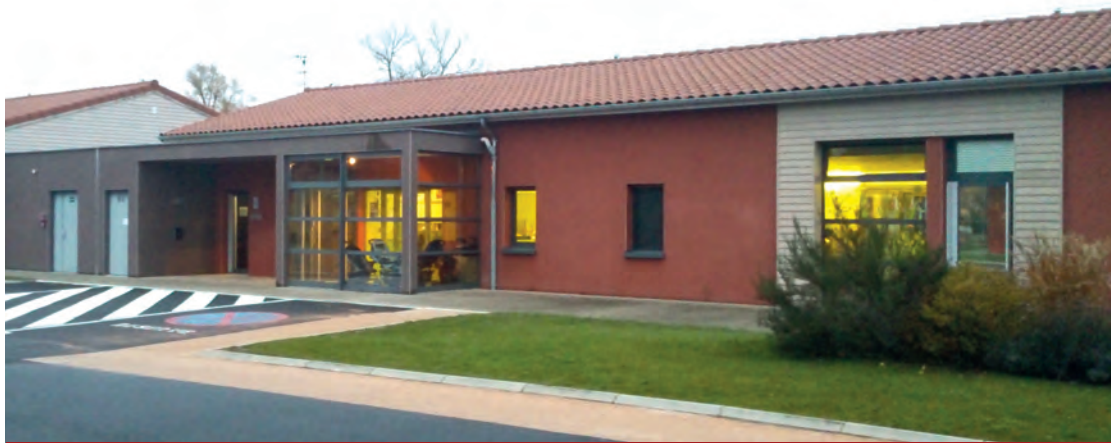
Les Jonchères, crèche et accueil de loisirs du site de Saint-Germain-Laprade.

Le SIVOM a pour mission d'apporter aux parents qui le souhaitent les prestations et les activités prévues par le projet d'établissement, dans des espaces aménagés, pour offrir un accueil de qualité aux enfants qui fréquentent ses structures.