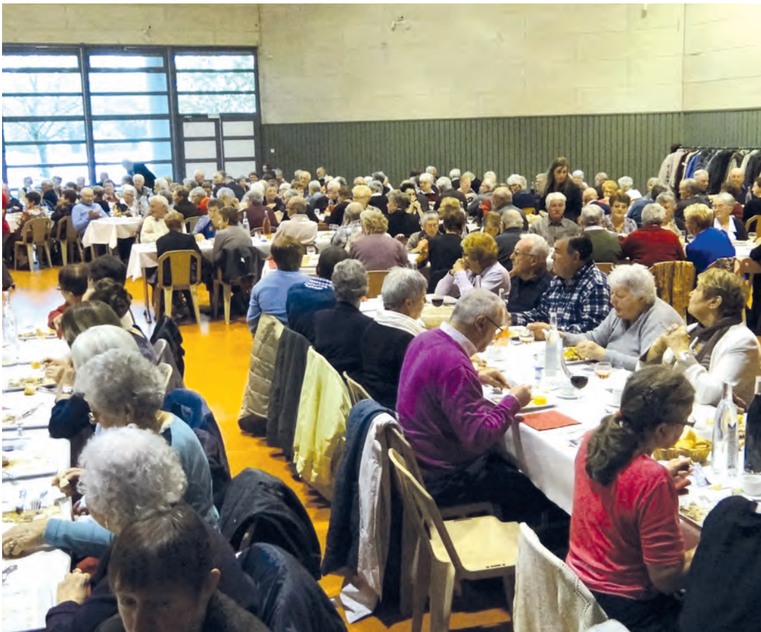
La convivialité était au rendez-vous autour d'un excellent repas.

Le 9 novembre, le repas des aînés s'est déroulé dans une ambiance sympathique.