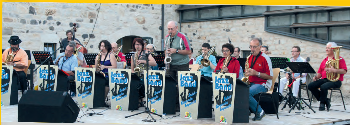
Le Jazz-Band de Saint-Germain a fait swinguer le public.