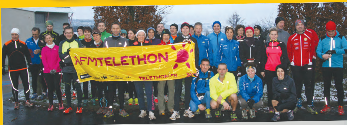
Les associations à l'ouvrage pour le Téléthon.