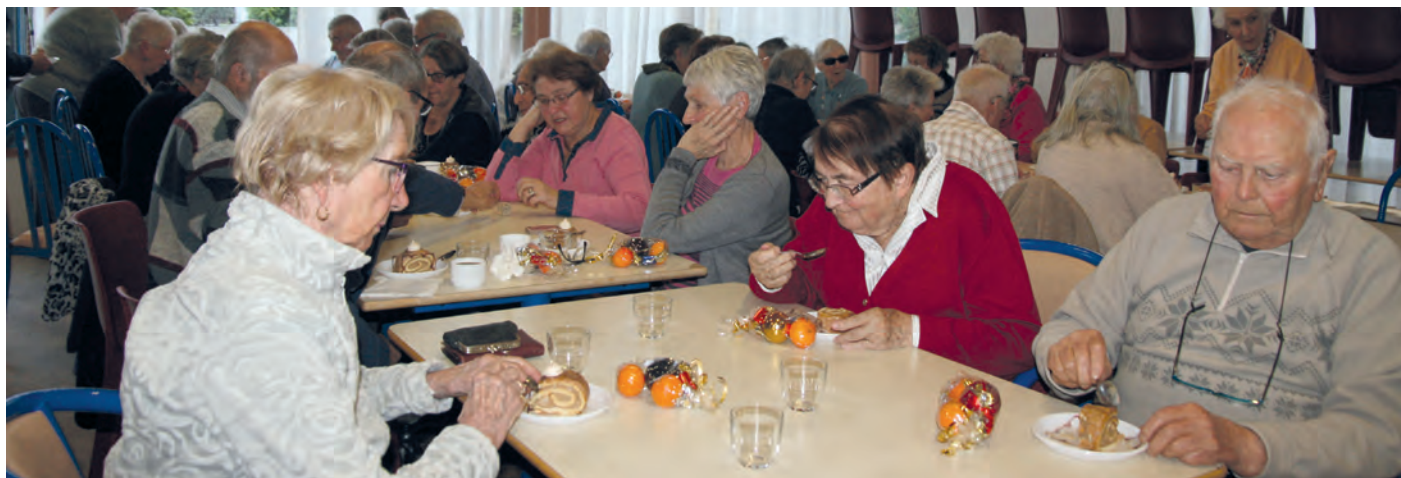
Le club des Genêts d'Or joue un rôle essentiel dans le quotidien de nos aînés.

Les habitants des villages éloignés du bourg pointent le manque de transport. Certains souhaitent des moments d'information sur leurs droits en tant que personne âgée. L'emplacement des boîtes à lettres parfois éloignées des domiciles pose problème. Il manque de boîtes à lettres pour le départ du courrier dans quelques lieux.