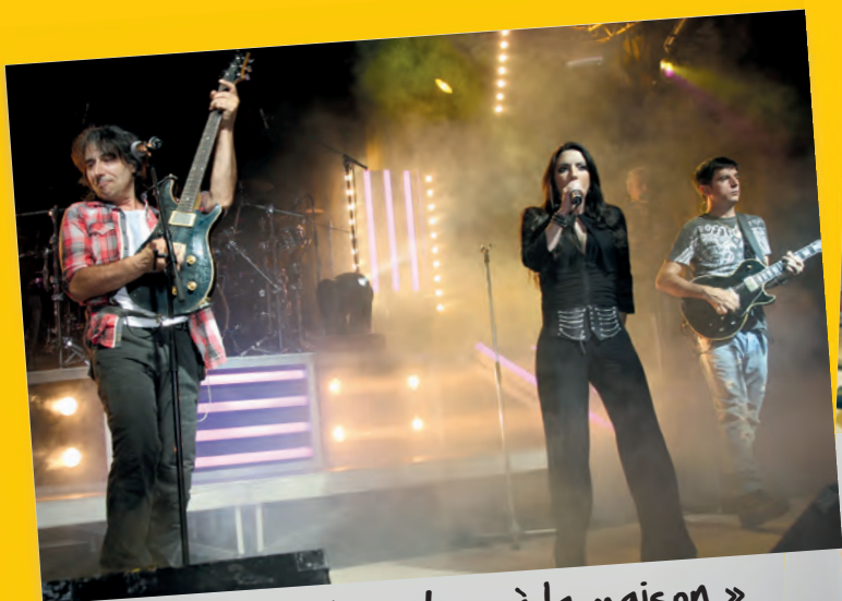
Motel, « de retour à la maison » pour la Fête de la musique 2014.