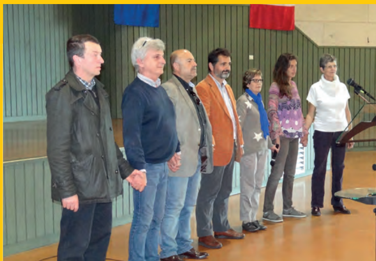
Les maires et les représentants des 3 communes jumelées : Calco, Naquera et Saint-Germain-Laprade.