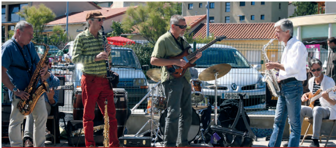
Des musiques diverses et variées ont créé de belles ambiances pour la vogue.

Chargée de coordonner et de participer à l'animation de notre commune, la commission vie communale n'a pas ménagé ses efforts pour atteindre ses objectifs de renouvellement des diverses animations.