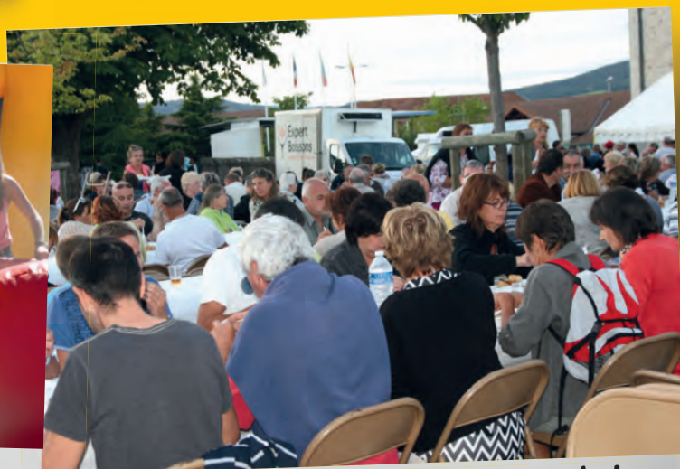
Un esprit convivial autour des plats préparés par les associations.