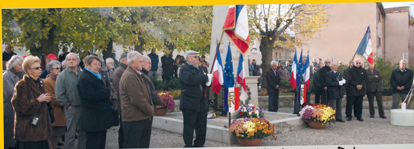
Une cérémonie du 11 Novembre dévoilant la plaque des Poilus de Saint-Germain-Laprade morts pour la paix.