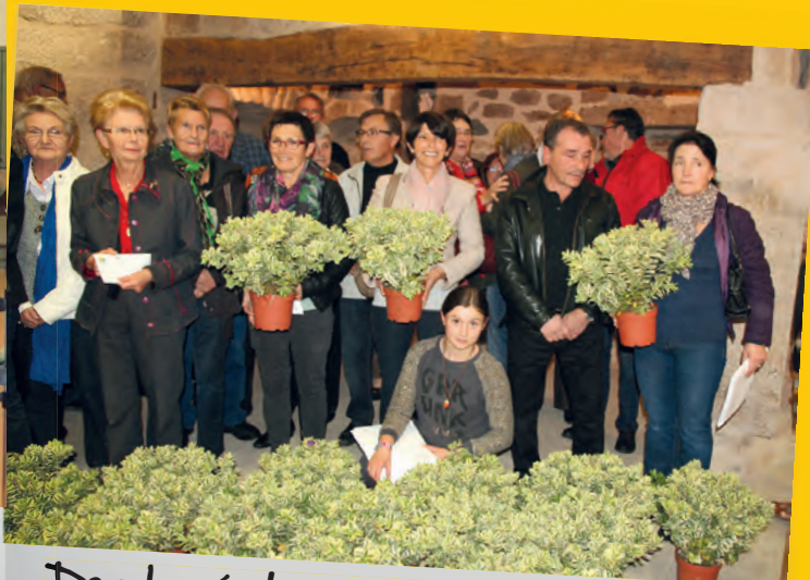
Des lauréats récompensés pour leur participation aux maisons fleuries.