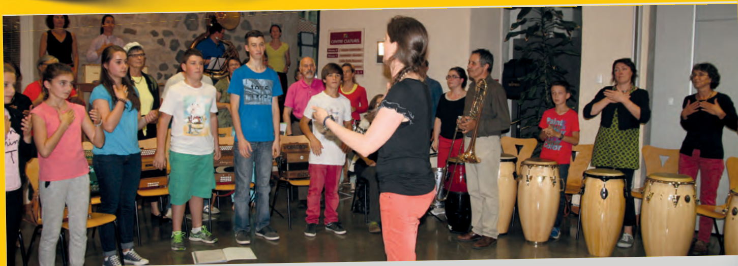
Les Ateliers des Arts ont enchanté les mélomanes par leur récital.