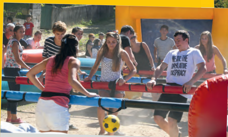
Comme le baby-foot humain, de nombreuses animations ont contribué au succès de la vogue 2014.